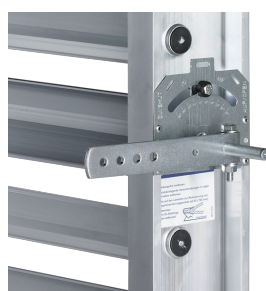
FESTSTELLVORRICHTUNG AN JZ-AL, JZ-HL-AL

Die Feststellvorrichtung befindet sich immer zwischen der ersten und zweiten Lamelle von oben