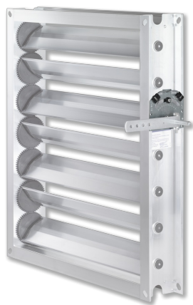
FESTSTELLVORRICHTUNG AN JZ-AL