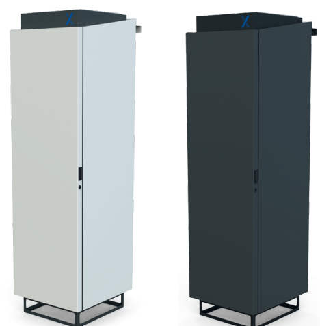
Weiß RAL 9016