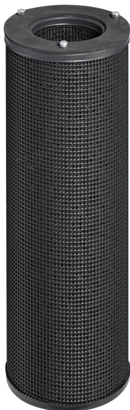
AKTIVKOHLE- FILTERPATRONE, SERIE ACFC AUSFÜHRUNG PLA