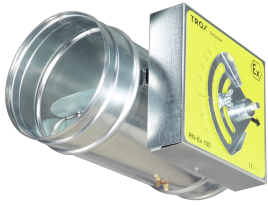
KVS-REGLER SERIE RN-EX