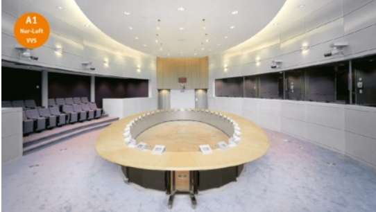
Berlaymont, Brüssel, Belgien

Ist bei der raumluftechnischen Planung eines Bürogebäudes von ganz unterschiedlichen nutzungs- und architekturbedingten Parametern auszugehen, sollte eine variable Volumenstromregelung vorgesehen werden. Sie sorgt dafür, dass Luftvolumenströme variabel in Abhängigkeit von der jeweiligen Nutzungssituation der Räume angepasst werden können. Eine automatische Anpassung an sich ändernde Parameter dank intelligenter Regel- und Kommunikationssysteme erhöht die Effizienz einer Anlage spürbar.