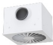
Side entry, circular spigot