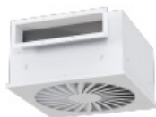
Side entry, rectangular spigot