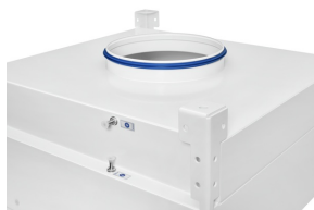
Runder Anschlussstutzen mit Lippendichtung