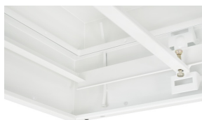
Messrohr innen zur Probenahme für Partikelmessung