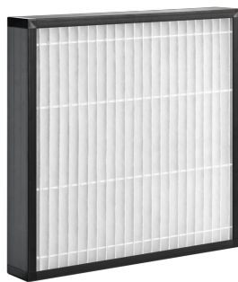
Z-Line-Filter, Ausführung PLA