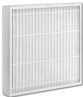
Z-Line Filter, Ausführung NWO