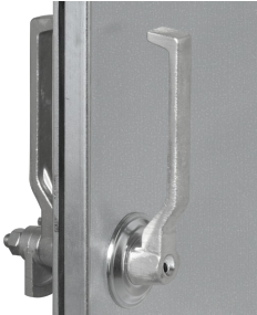
ABNEHMBARER FRONTHEBEL (VOM DOPPELHEBELVERSCHLUSS)