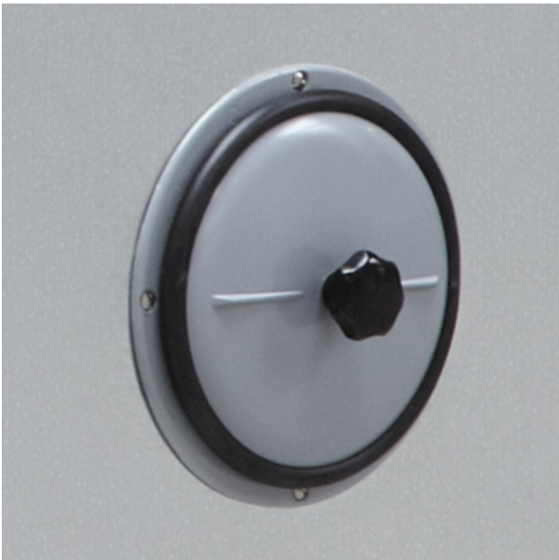
Abnehmbarer Fronthebel (vom Doppelhebelverschluss)